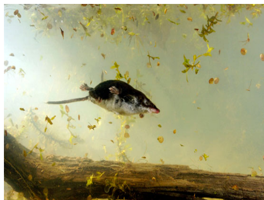
Sommersibile in miniatura: l'animale dell'anno in immersione.