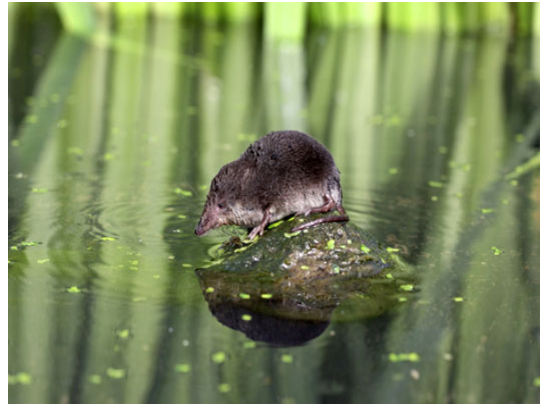
L'animale dell'anno 2016 preferisce stare vicino all'acqua.