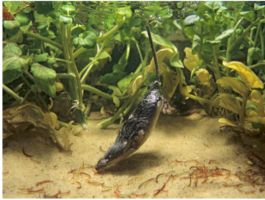
L'animale dell'anno 2016 vive dove l'acqua è pulita.