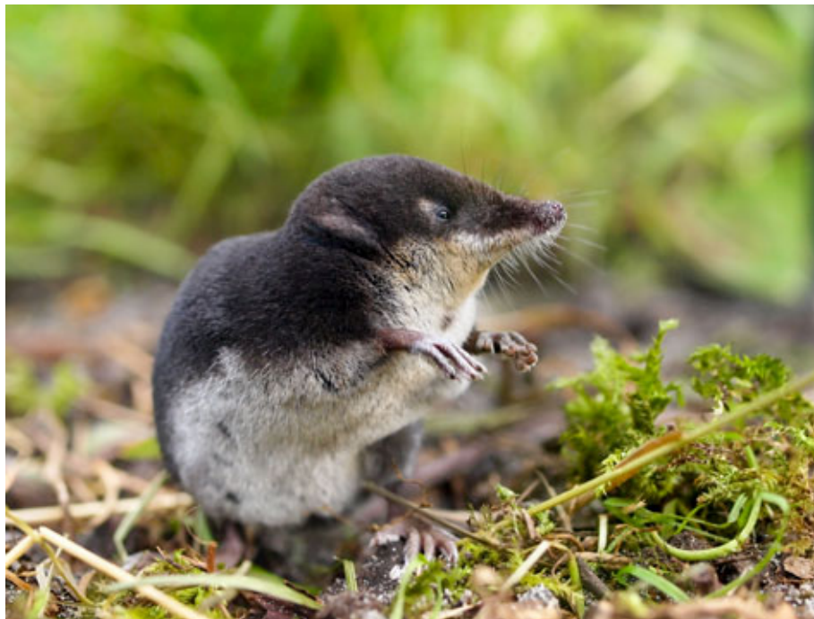
Il toporagno d'acqua, eletto da Pro Natura animale dell'anno 2016.

Download: www.pronatura.ch/foto-animale-dell-anno-2016